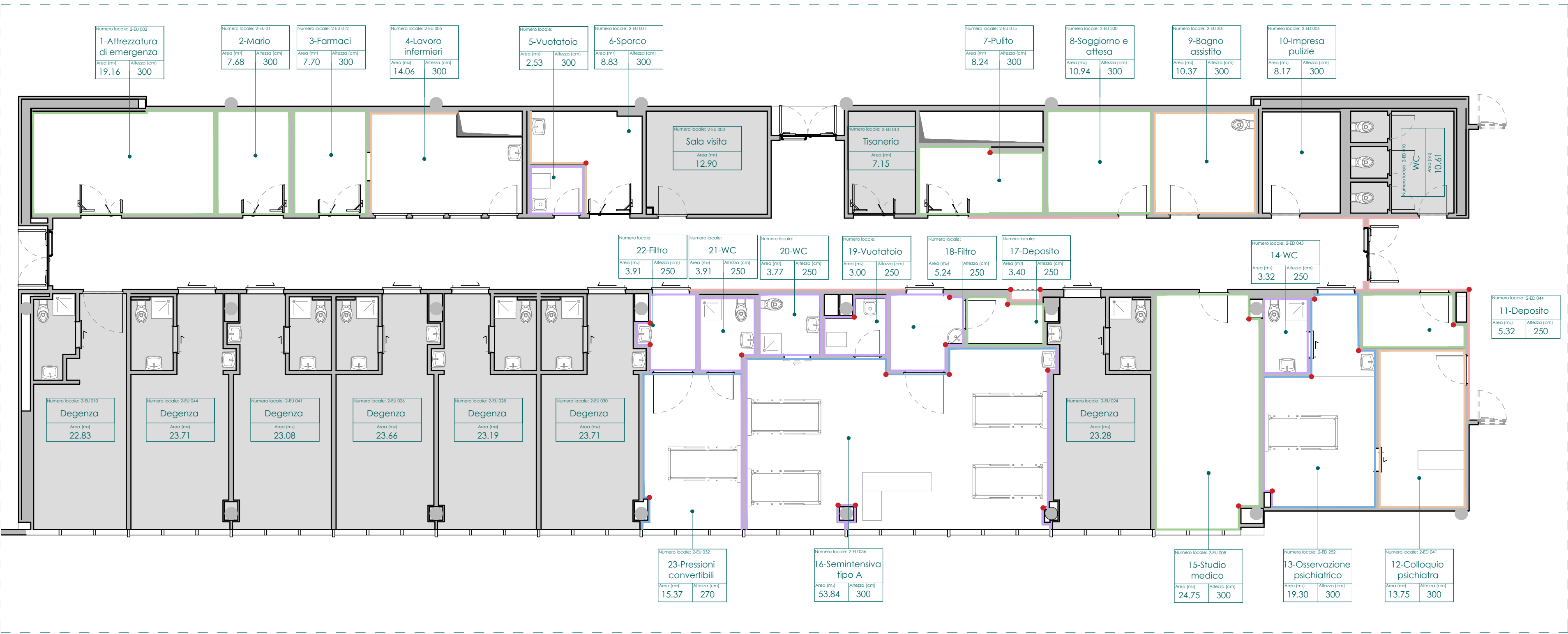
1 Planimetria generale 1:100

LEGENDA (colori sono da intendersi a solo scopo illustrativo e dovranno essere campionati e approvati dalla D.L.)